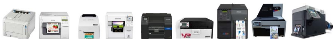
OKI C650dn Epson C3500 Primera LX500e/LX500ec Epson C4000 BK/C4000 MK Epson C6000/C6500 VIPColor VP600/VP650 Epson C7500/C7500G VIPColor VP700/VP750 OKI Pro 1040/1050